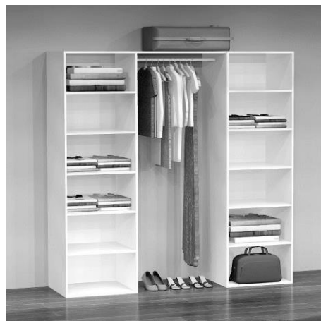
GD 3200 B: 197 cm