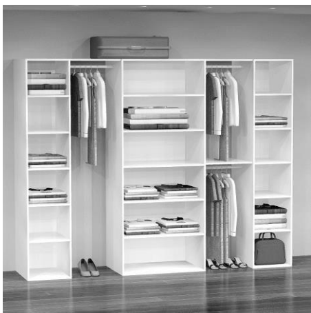
GD 6260 B: 253 cm