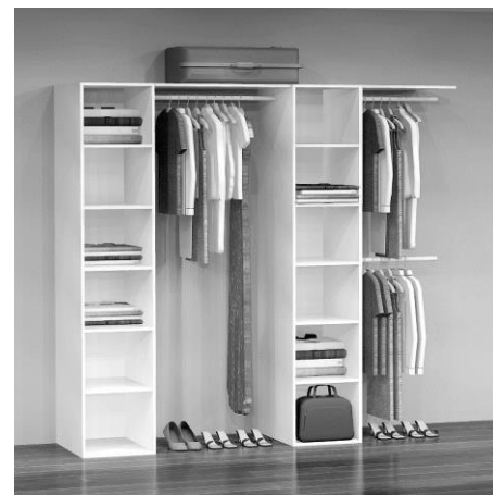
GD 4220 B: 213 cm