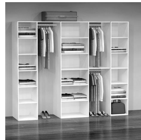
GD 5240 B: 233 cm