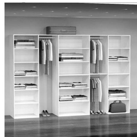
GD 8300 B: 294 cm