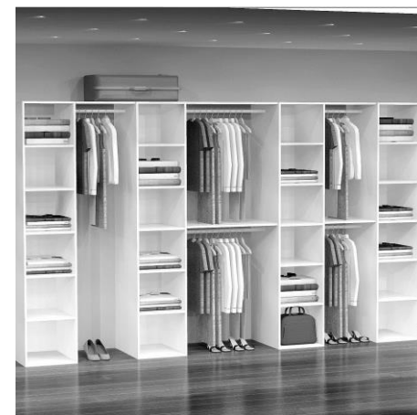
GD 10340 B: 330 cm