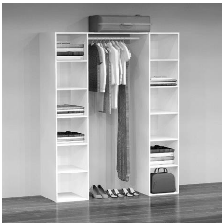
GD 1160 B: 157 cm