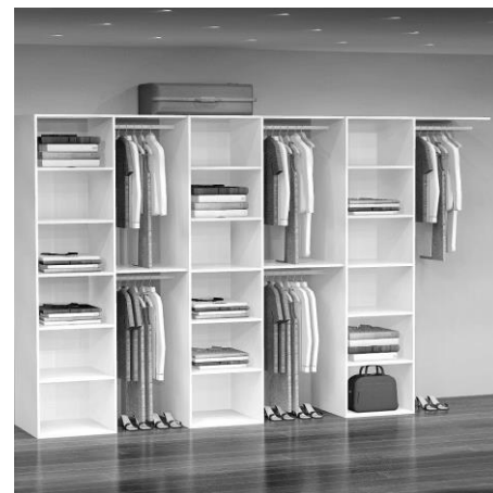
GD 9320 B: 310 cm