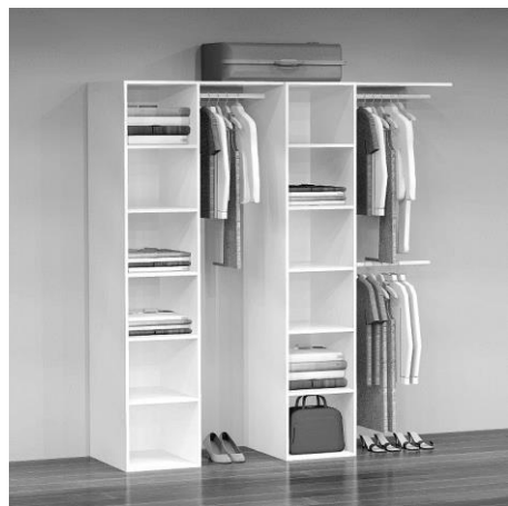
GD 2180 B: 183 cm